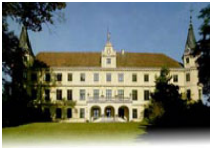
Bildungshaus Schloß Puchberg bei Wels