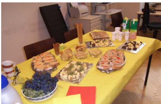
Stärkung für die Gäste beim Tag der offenen Tür