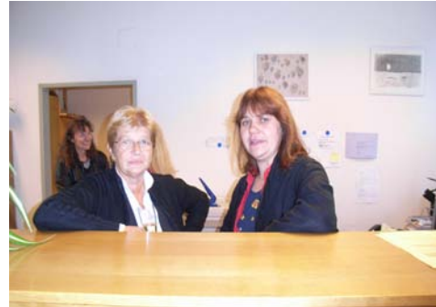
Geschäftsführerinnen des Vereins DANAIDA