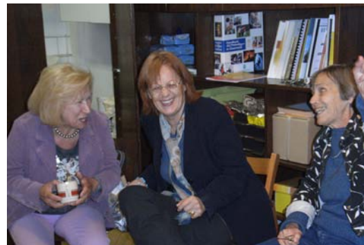
GEFAS Steiermark sorgt für gute Laune