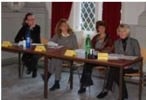
VertreterInnen zum Thema „Pflege und Gewalt im häuslichen und stationären Bereich“